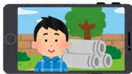
屋外等、指定場所以外での視聴