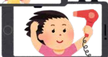
ドライヤーをしながら