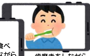
歯磨きをしながら